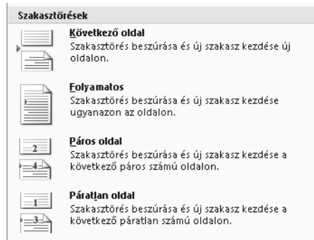
A szakasztörés fajtái a Töréspontok paranccsal érhetőek el.