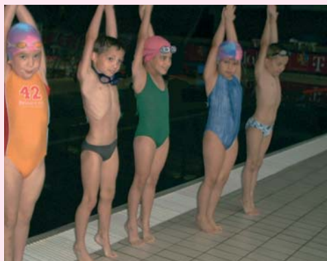
„Lezárt fej” tartás mellett lábujjra állás.