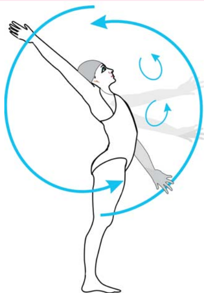
A karcsere helyes végrehajtása.

Amikor az emelkedő kar felér a fül mellé, akkor a mozgás megáll.